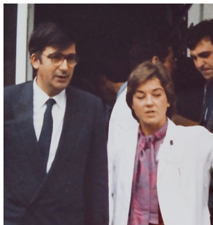
Junto a Ernest Lluch

A finales de 1988 dejó la dirección de Cruces y se dedicó por completo a lo que quizás haya sido lo mejor de su obra: la Hospitalización a Domicilio. Ya había dirigido la creación de aquel servicio desde su puesto de directora, pero a partir de entonces lo guió por una senda de crecimiento y buen hacer que lo convirtió en un modelo a copiar, primero en Euskadi, y más tarde en toda España. En 2004 consiguió, por primera vez para un servicio asistencial (junto con el Servicio de Urgencias de Pediatría), la certificación de calidad AENOR-ISO que mantuvo hasta su marcha. Continuó en este Servicio hasta su reciente jubilación por edad.