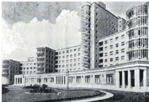
Residencia Sanatorial Enrique Sotomayor en 1955

Hoy, disfrutando de su jubilación en Getxo, recuerda sus primeros años haciendo constar el buen trato que recibió a su llegada a Cruces y a la Pediatría vizcaína.