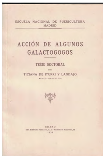
Portada de su tesis doctoral

Superadas estas y el doctorado, con la defensa de su tesis “Acción de algunos galactogogos” que fue calificada con un sobresaliente, obtuvo el destino en Bilbao, en la Dirección Provincial de Sanidad y estableció su consulta en el nº 2 de la calle de los Fueros hasta que fundó una clínica en Begoña para asistir a partos y a enfermas de su especialidad. Compaginó el ejercicio de su vida profesional con la divulgación de sus conocimientos de higiene y maternología mediante artículos, conferencias y congresos. Tuvo una relación estrecha con “Emakume Abertzale Batza” y formó parte del profesorado de la escuela de enfermería organizada en el Centro Vasco de la calle Bidebarrieta, de Bilbao. Se distinguió por su defensa de los derechos de las madres solteras.