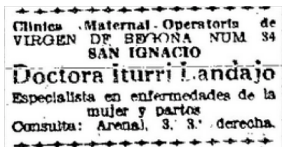
Gaceta del Norte del 21 de marzo de 1948