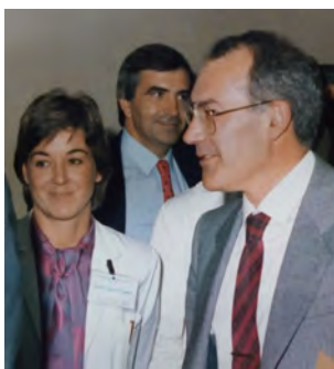
Junto al Lehendakari Ardanza

laboral por enfermedad o accidente y a la supervisión de la justificación de todas las peticiones de exploraciones o análisis fuera del hospital. Ténganse en cuenta que Cruces no contaba entonces con TAC ni determinados análisis clínicos que debían solicitarse no solo fuera del hospital sino de la provincia y que suponían un importante gasto para el centro. Enfocada en la Gestión, se graduó en Gerencia Hospitalaria por la Universidad de Deusto en 1984 e hizo un curso de Gestión Gerencial de la Universidad de Navarra (Instituto de Estudios Superiores de Empresa) en 1987.