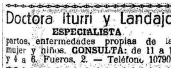
La Gaceta del Norte 2 de enero de 1934